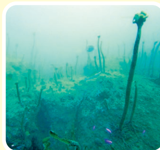
■藻食性魚類（アワビ）による食害

当地域の磯焼けは、平成初め頃に部分的に見られる程度でしたが、その後は急速に藻場の衰退が進み、数年後には海域全ての藻場が消滅してしまいました。それにより特産であったサガラメ（牧之原市相良が名称の由来）の採藻漁業も途絶えると共にアワビ等の漁獲量も激減するなど、生態系と水産資源に与える藻場の重要性を改めて実感しました。