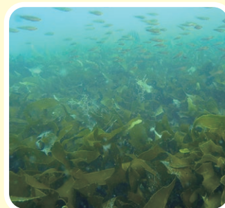
■復活したカジメ藻場に群れる魚